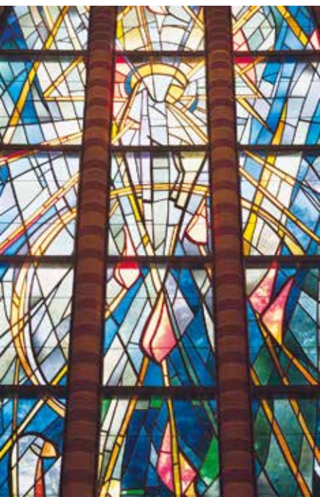
Foto: Altarfenster in der Samariterkirche

Liebe Leserinnen und liebe Leser aus Friedrichshain und anderswo,