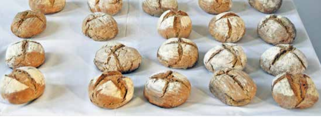
Foto links: Diese tollen Brote wurden zur Brotbackaktion 5000 Brote in St. Markus gebacken. Dort wurde sogar ein Lehmbackofen gebaut. Auf der nächsten Seite erfahrt ihr mehr über diese Aktion und dem Bau des Lehmbackofens.