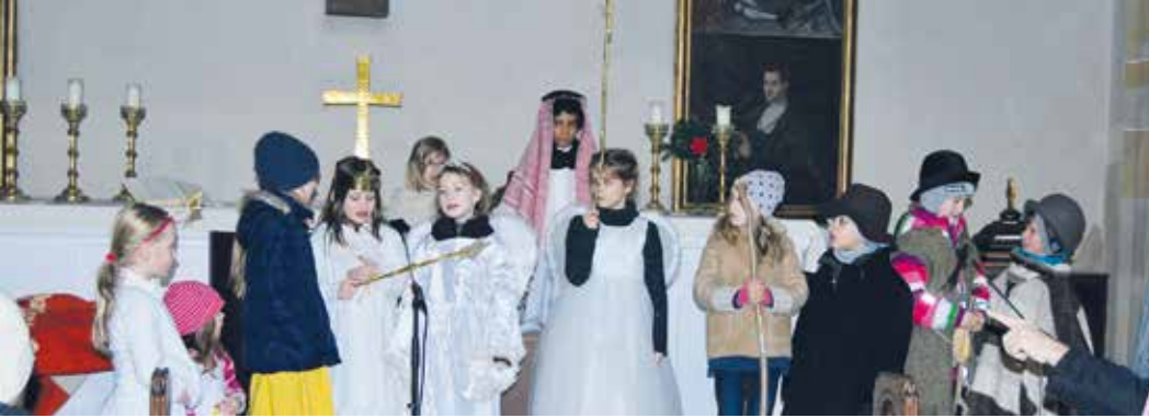
Foto: Krippenspiel in der Pfingstkirche