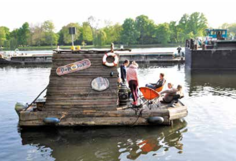
Foto: Auf zu neuen Ufern – alte Grenzen überwinden, eine Aktion von „Kinder brauchen Matsch“ aus der Auferstehungsgemeinde, an der Spree in Alt-Stralau.

ten wie den Kinderchören, gibt es in Boxhagen Stralau seit rund einem Jahr jeden Sonnabend die KubuKi-Ki (kunderbunte Kinderkirche), in St. Markus soll besonders rund um das Lazarus-Haus die gemeindliche Arbeit mit Kindern gefördert werden. So wurde hier ein Brotbackofen ge-