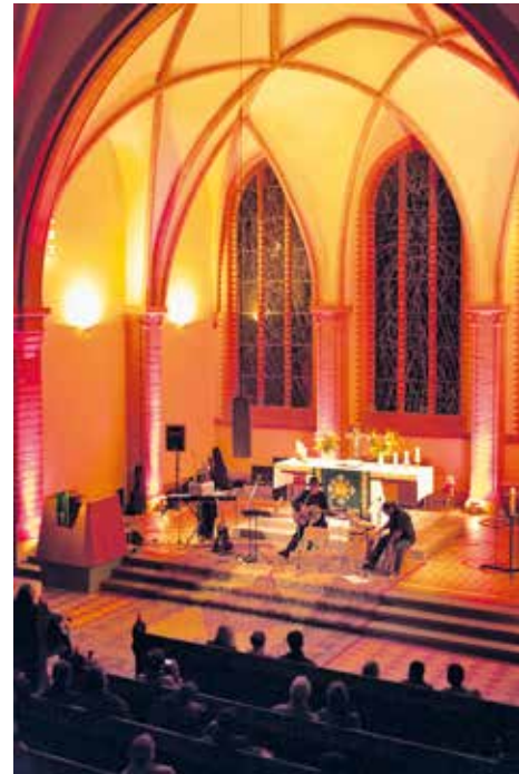
Foto: Konzert in der Samariterkirche