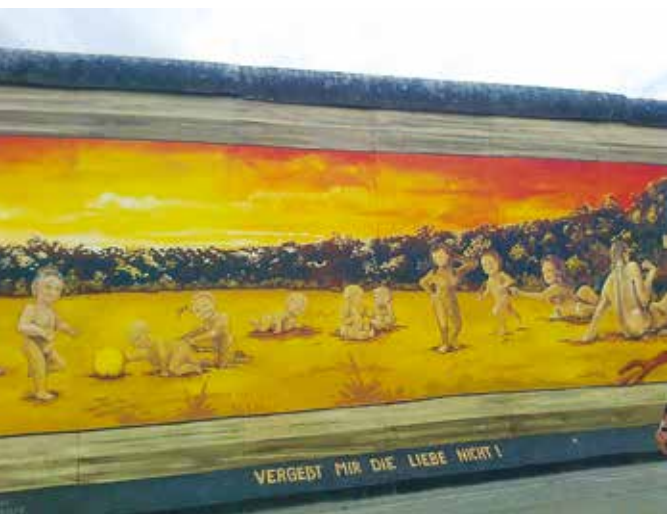
Foto: Bild auf dem ehemaligen Mauerstreifen der East Side Gallery in der Mühlenstraße Berlin-Friedrichshain.