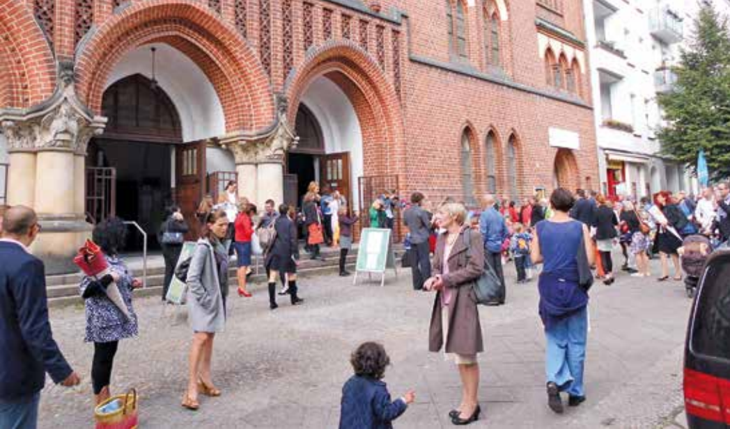
Foto: Einschulungsgottesdienst am 30. August 2014 in der Pfingstkirche