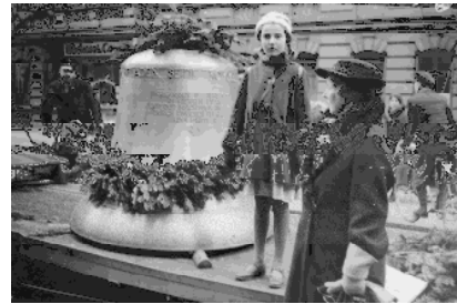
Neue Bronzeglocken für Lazarus 1936

Der Gemeindegemeinderat wünscht sich für das Lazarus-Haus ein Geläut und lädt herzlich ein zu einer Gemeindeversammlung , um sich darüber auszutauschen. Termin ist Montag, der 21.9. , um 19.00 Uhr im Lazarus-Haus . Fachliche Beratung geben uns der Glockensachverständige der Landeskirche, Herr Kairies, und Herr Thamm, Architekt beim Kirchlichen Bauamt.