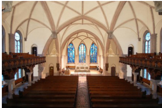
Samariterkirche nach der Sanierung