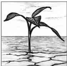
Erster Advent: Hoffnung