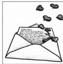
Dritter Advent: Liebe