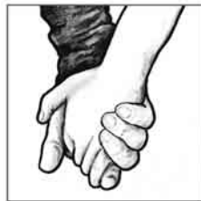
Zweiter Advent: Freundschaft